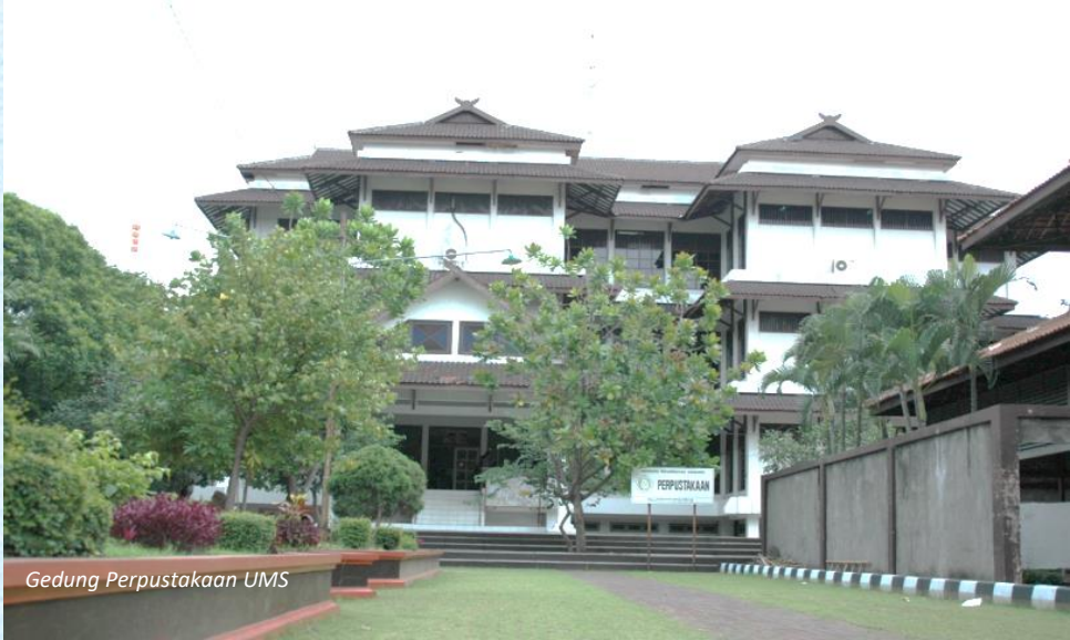
Gedung Perpustakaan UMS