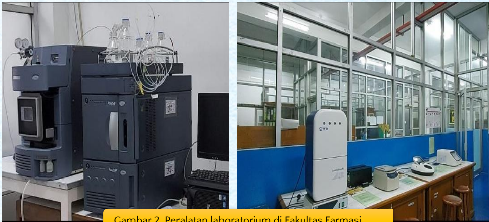
Gambar 2. Peralatan laboratorium di Fakultas Farmasi