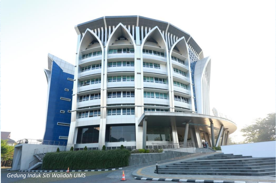
Gedung Induk Siti Walidah UMS